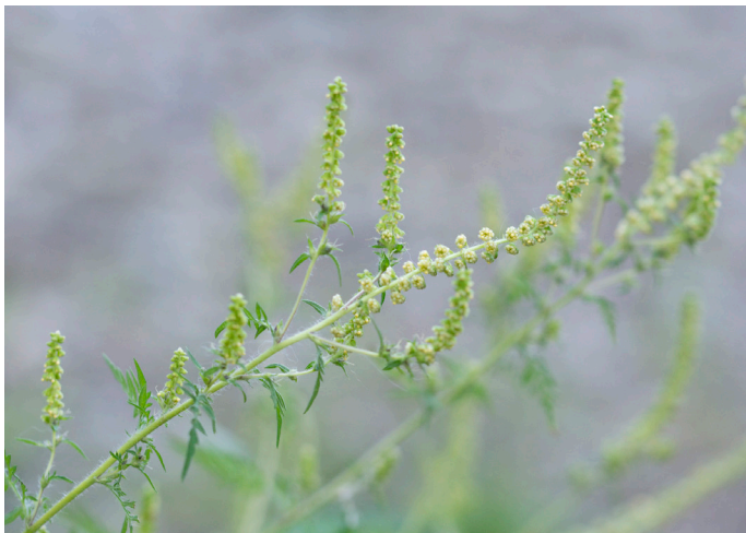
Beifußblättriges Traubenkraut

Steigende Durchschnittstemperaturen und veränderte Niederschlagsmuster begünstigen die Verbreitung von Neophyten. Da sie über eine hohe Reproduktion und gute Anpassungsmechanismen verfügen und vor Ort keine natürlichen Feinde haben, bilden sie mancherorts Dominanzbestände. Wärmere Temperaturen ermöglichen es Neophyten zudem in höheren Breitengraden und Höhenlagen zu überdauern und sich auszubreiten. Dieses invasive Verhalten verdrängt einheimische Arten. Die heimische Biodiversität und die damit verbundenen Ökosystemleistungen werden dadurch nachteilig beeinflusst.