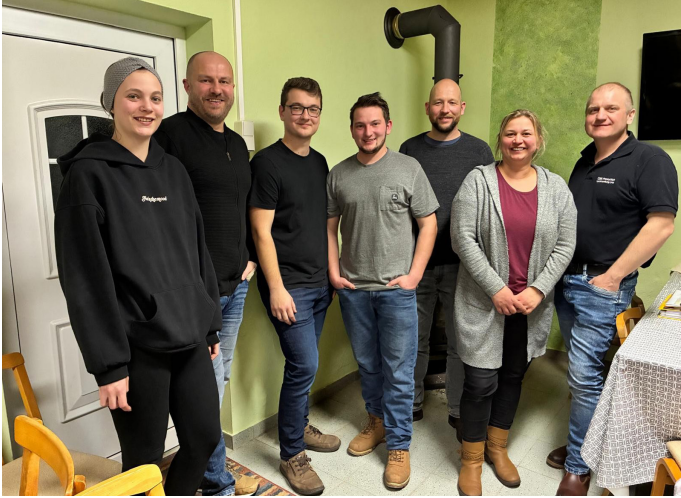
Am 5. Jänner fand die Jahreshauptversammlung des Club Harmannstein statt. Der Obmann