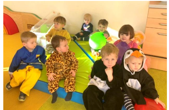
Faschingsfeier 2023 in der Tagesbetreuung