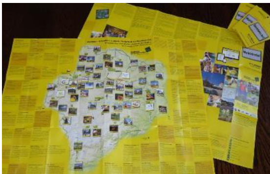
Die Landkarte macht Lust aufs Waldviertel

Bestellen Sie sich noch heute kostenfrei ein Exemplar und sehen Sie selbst! Kurzes Email an office@wohnen-im-waldviertel.at oder einfach eine Karte am Gemeindeamt abholen!