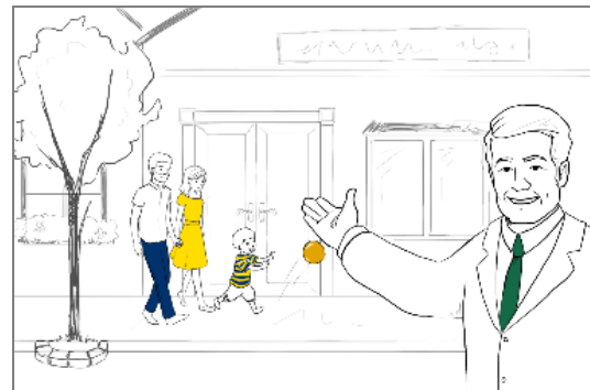
Erklärvideo: Das Wichtigste in aller Kürze.