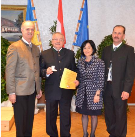
Karl Wagner Ehrennadel in Gold