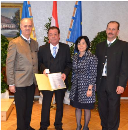
Johann Mayer Ehrennadel in Silber