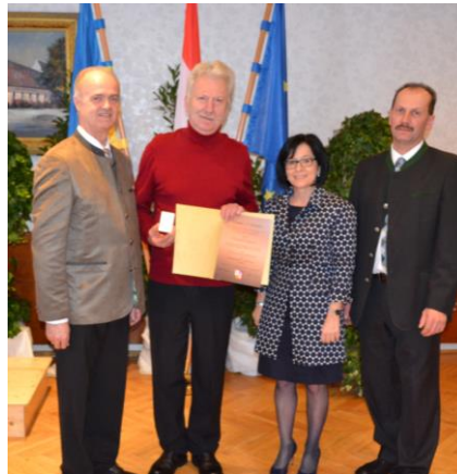
Rudolf Artner Ehrennadel in Bronze